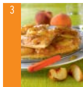
3 Tarte Tatin aux pêches blanches d'ici