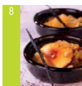
8 Sablés au safran et pêches jaunes d'ici fondantes