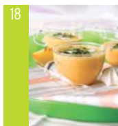
18 Cappuccino de pêches d'ici glacées aux pistaches