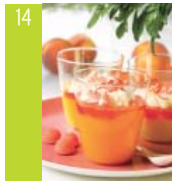
14 Verrines à la compote de pêches d'ici, mascarpone et fraise tagada