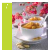
7 Compotée de pêches blanches d'ici aux amandes et à la fleur d'oranger