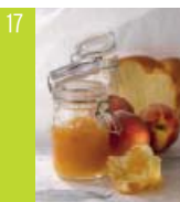
17 Confiture de pêches d'ici aux épices douces et au gingembre