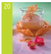
20 Granité de pêches blanches d'ici, tuiles et infusion de citronnelle

8 fondus de pêches sur 10 la croquent à pleines dents, et 8 sur 10 associent la dégustation à un moment de détente (3)