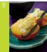
11 Nectarines d'ici farcies au riz au lait gingembre et citron