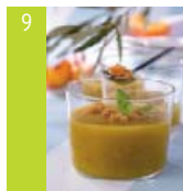
9 Gaspacho de nectarines d'ici au pain d'épice et au basilic