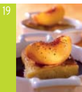
19 Brioche perdue aux pêches d'ici, jus de mûre et poivre noir