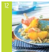
12 Brochettes de lotte aux pêches d'ici et au thym