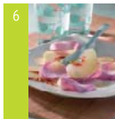
6 Carpaccio de pêches blanches d'ici et pétales de rose cristallisés