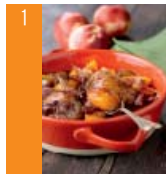
1 Coq au vin et aux nectarines jaunes d'ici