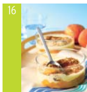
16 Tiramisu aux pêches d'ici et vin de Banyuls