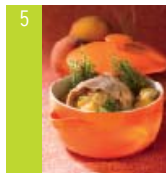
5 Râble de lapin farci aux pêches d'ici et au thym frais