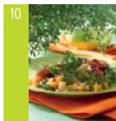
10 Salade de roquette aux pêches d'ici, Bresaola et Provolone