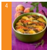
4 Tian d'agneau aux pêches d'ici