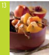
13 Piquets de volaille aux nectarines d'ici et vinaigre balsamique