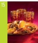
15 Tajine de veau aux pêches d'ici et aux noix de cajou