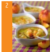
2 Crèmes brûlées aux nectarines blanches d'ici